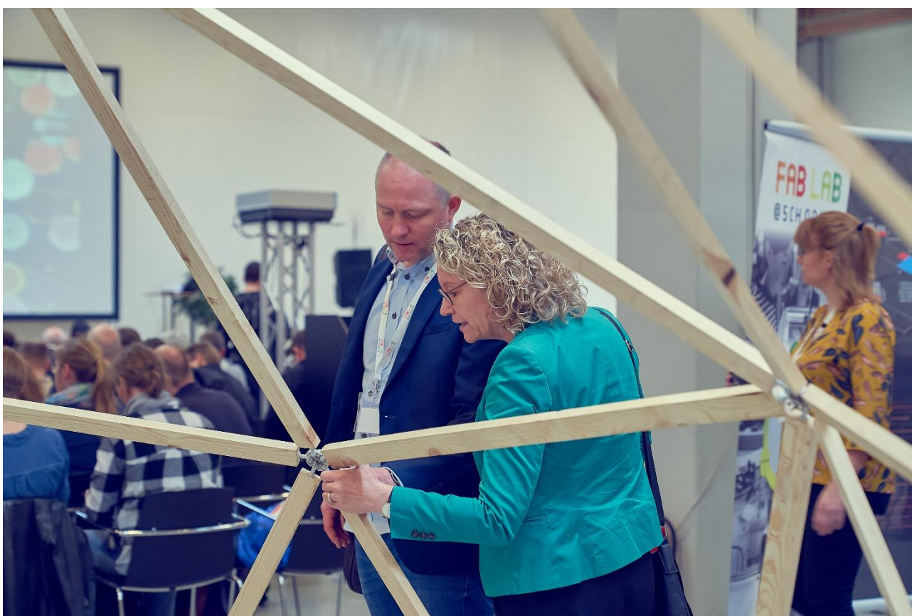
Foto indefra Kulturkuppel fablearnDK 2018